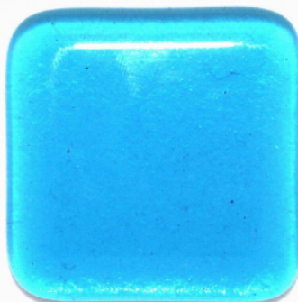
2 Schichten, insgesamt 6 mm Kein Formverlust, sehr schön gerundete Ecken