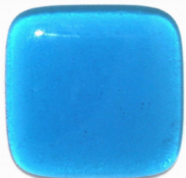
3 Schichten, insgesamt 9 mm größer und aufgebläht